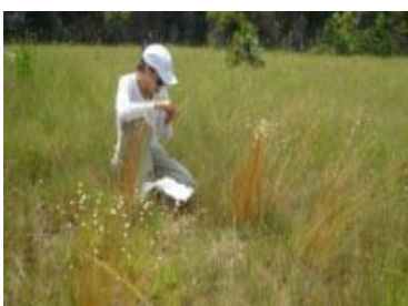
Victoria Hale Institute for OneWorldHealth (07:12 min)

„International Bridges to Justice“ ist eine Organisation zur Stärkung der Bürgerrechte. Sie unterstützen Rechtshilfcenter bei ihrer Arbeit, veranstalten Fortbildungen für Strafverteidiger und wecken das gesellschaftliche Bewusstsein für Menschenrechtsverletzungen.